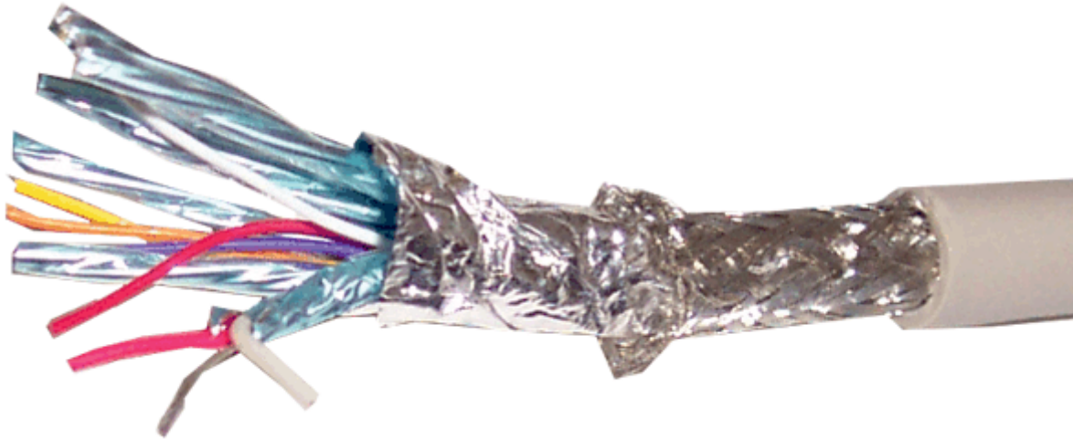
DVI HDMI Rohkabel, single link, digital